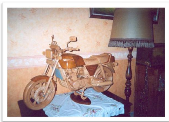
Modèle en bois (échelle ½) de Claude JAVENOT